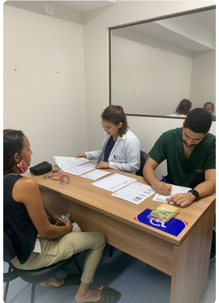
Alunos de Medicina prestando atendimento à população